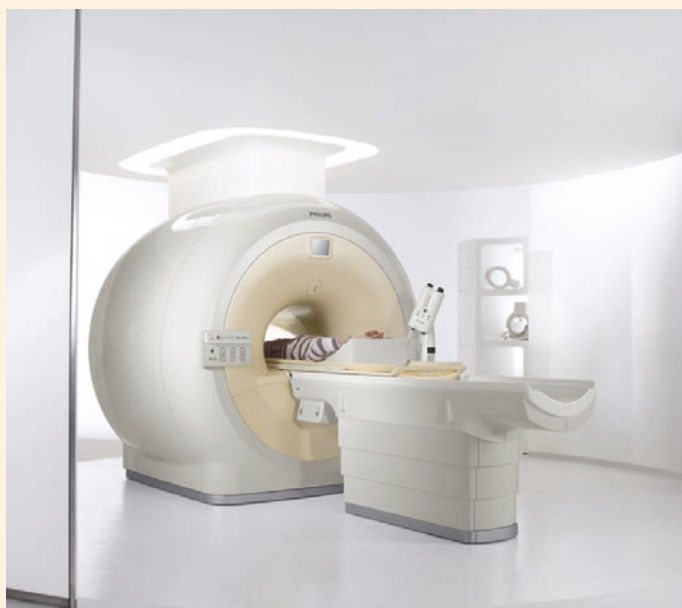
Figuur 1. Achieva MRI-scanner

Kenmerkend voor embedded systemen is de gedwongen samenwerking tussen softwareontwerpers en ontwerpers uit de hardware en fysica. Hierdoor ontstaat een extra dimensie van complexiteit, boven op de uitdagingen van marktdynamiek, interoperabiliteit van systemen, betrouwbaarheid, energiegebruik, beveiliging en creativiteit. Architectuur kan helpen de verschillen tussen disciplines te overbruggen.